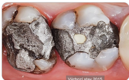
Výchozí stav 2015

Vážená pani doktorka, Vážený pán doktor, RKZL Žilina v spolupráci s firmami EuDent a Dentsply Sirona si Vás dovoľuje pozvať na teoretické a praktické školenie