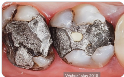
Výchozí stav 2015

Vážená pani doktorka, Vážení pán doktor, Slovenská komora zubných lekárov RKZL Trnava v spolupráci s firmou EuDent a Dentsply Sirona Vás pozývajú na školenie