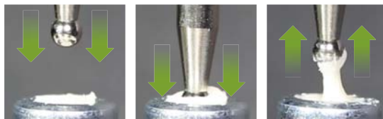
Piesty boli ponorené do namiešanej hmoty a okamžite vytiahnuté.

Aplicap™ sa nelepí na kovovú guľôčku, zatiaľ čo na ostatných testovaných skloionomérených výplňových materiáloch je možno pozorovať lepiivosť po tom, čo bol nástroj vytiahnutý.