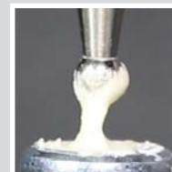
Riva Self Cure Caps