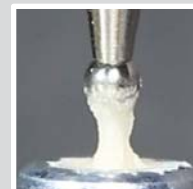
EQUIA™ Fil Caps