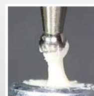
GC Fuji IX GP® Caps