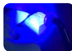
Extraorálna polymerizácia svetlom

TEMPSMART DC je možné vytvrdzovať svetlom , čo ponúka úžasné výhody: dokážete ustrážiť moment tuhnutia a finálna polymerizácia je tak optimalizovaná. To umožňuje jednoduchší a efektívnejší postup, vďaka čomu ušetříte veľa času . Polymerizácia taktiež zlepšuje fyzikálne vlastnosti dočasnej náhrady, najmä pevnosť v ohybe.