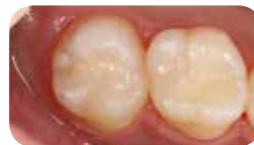
Pooperačný stav ukazuje vynikajúcu farebnú adaptáciu s prirodzeným zubom