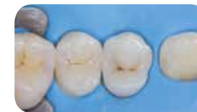
Výplň s everX Posterior ako dentínové jadro a Essentia Universal pre pokrytie