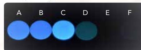
Fluorescencia 0,5 mm diskov. A: G-CEM Veneer; B: Variolink Esthetic; C: Panavia V5; D: NX3 Nexus; E: Calibri; F: RelyX Unicem