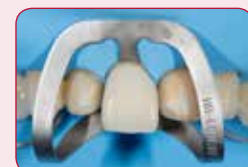
Predpokladaný konečný výsledok

So skúšobnou pastou Try-in paste môžete jednoducho predpokladať konečný výsledok. Pomáha pri výbere správneho odtieňa a opacity.