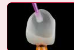
Naneste na povrch náhrady

Po správnej úvodnej úprave (leptanie alebo pieskovanie) G-Multi PRIMER zabezpečuje stabilnú väzbu na všetky estetické náhrady.