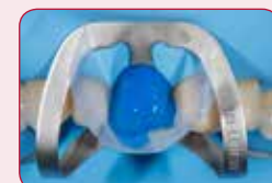
Zvoľte si svoj spôsob leptania

Naleptajte okraje skloviny alebo použite metódu total etch pre minimálne preparované časti, ktoré sú lokalizované hlavne v sklovine.