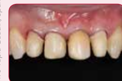
Štyri estetické odtiene

G-CEM Veneer je v štyroch rôznych odtieňoch. Boli starostlivo vybrané, aby uspokojili všetky estetické potreby.