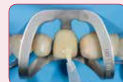
Nabondujte celý preparovaný povrch

Osvedčená formula G-Premio BOND zaručuje väzbu ku všetkým podkladom. Samostatne sa vytvrdzuje svetlom a je tak tenká, že nezasahuje do náhrady.