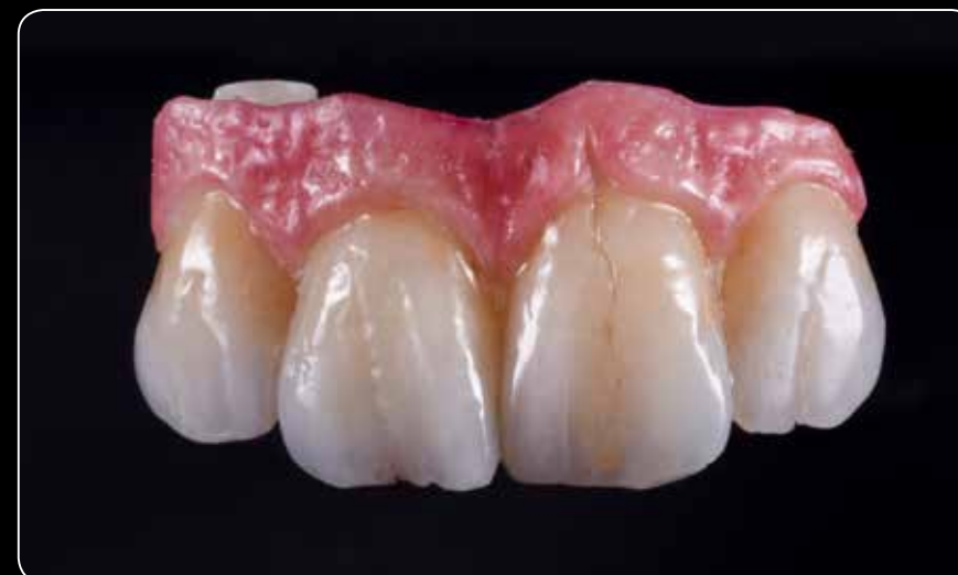
Krása zubov aj d'asien