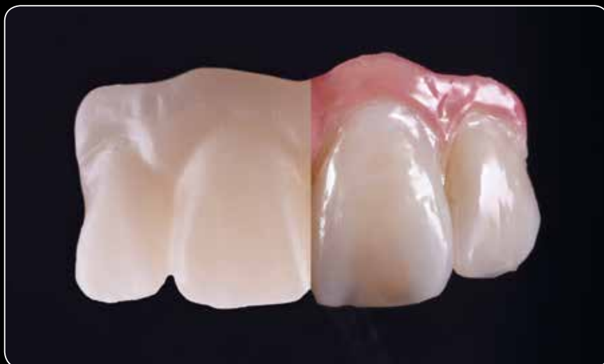
Maximálna estetika v mikro vrstve