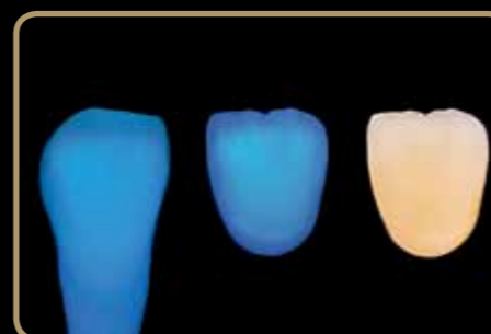
Zub vľavo: Initial LiSi

Špeciálne navrhnutá a prispôbená svetelnej dynamike lítium disilikátových konštrukcií