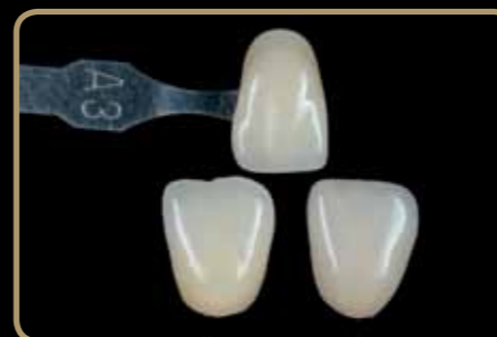
Zub vľavo: Initial LiSi

Vysoká stabilita pri pálení, dokonca aj počas viacnásobných pálení