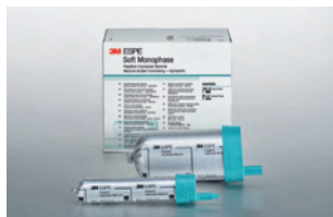
3M™ ESPE™ Soft Monophase doplňujúce balenie (31798)