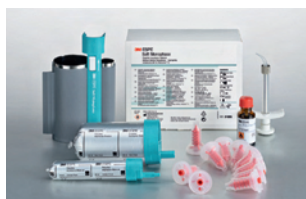
3M™ ESPE™ Soft Monophase úvodné balenie (31806)